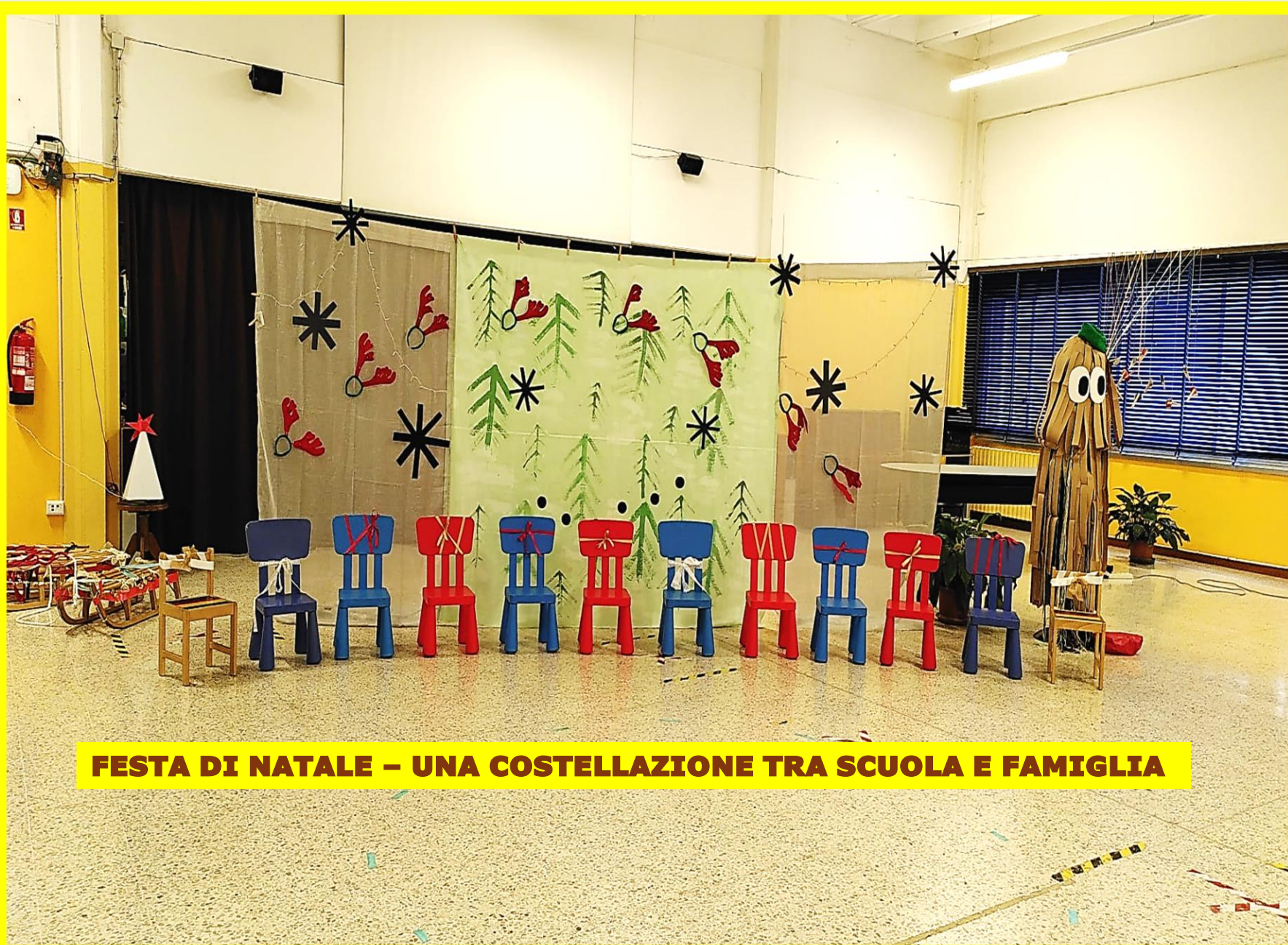
FESTA DI NATALE - UNA COSTELLAZIONE TRA SCUOLA E FAMIGLIA